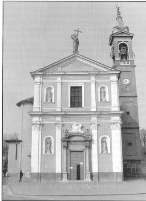
Chiesa parrocchiale di Ghiaie di Bonate dedicata alla Sacra Famiglia